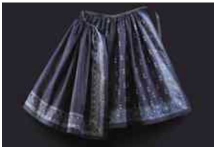
Fěrtoch z Černochovy barevny, VMP i.č. 9402