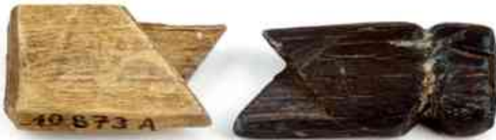
Dřevěný barvířský cejch z Janíkovy barevny, VMP i.č. 10873