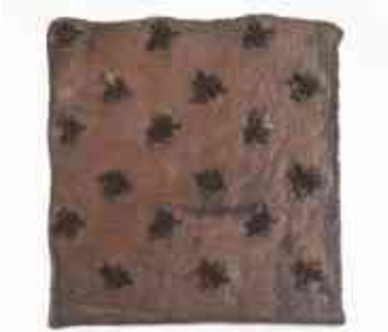
Forma modrotisková z Černochovy barevny, VMP i.č. 1332