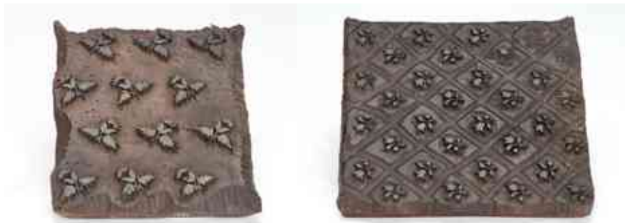
Modrotiskové formy s iniciálami JMB, i.č. 1308, i.č. 1328

Řemeslo barvířské v této rodové větvi Janem Bayerem (*1825) skončilo, byl posledním barvířem v Rožnově na č. 57. Podlehl zánětu plic ve věku nedožitých 60 let. Záznamy z úmrtních matrik dokládají, že v rodině Bayerů se plicní onemocnění vyskytovala poměrně často.