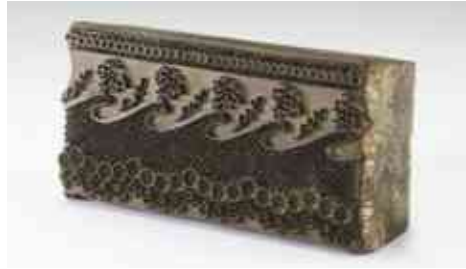
Forma modrotisková z Černochovy barevny, VMP i.č. 27571