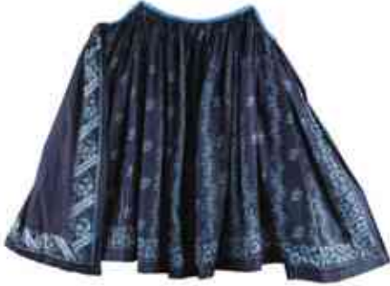
Fěrtoch z Černochovy barevny, VMP i.č. 25151