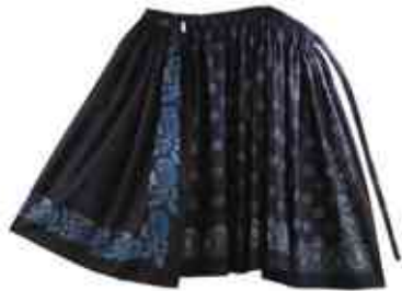
Fěrtoch z Černochovy barevny, VMP i.č. 26886

Dnes už není možné se zpětně dopátrat více informací o osobním životě našich předků z období staršího než polovina 19. století, spíše však jen z jeho druhé poloviny a z přelomu 19. a 20. století. Můžeme čerpat z archivních pramenů, které zaznamenávaly věci úřední a správní, spolkové, nějaká data můžeme vyčíst z různých typů smluv zaznamenaných v gruntovních knihách (převody majetku, svatební smlouvy). Také kroniky nebo pozůstalostní spisy poskytují informace o rodinných a majetkových