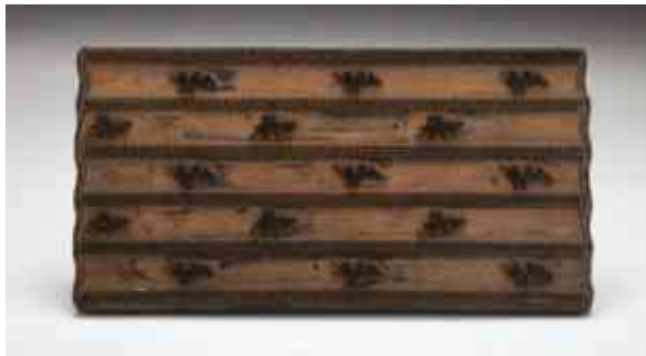
Forma modrotisková z Černochovy barevny, VMP i.č. 1357