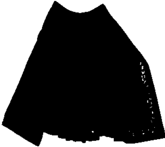
Fěrtoch z Černochovy barevny, VMP i.č. 967