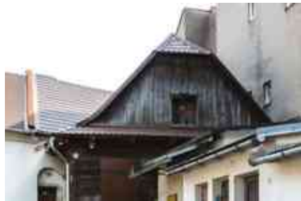
Dům č. 175 v Rožnově, zbytky roubení na zadní straně domu