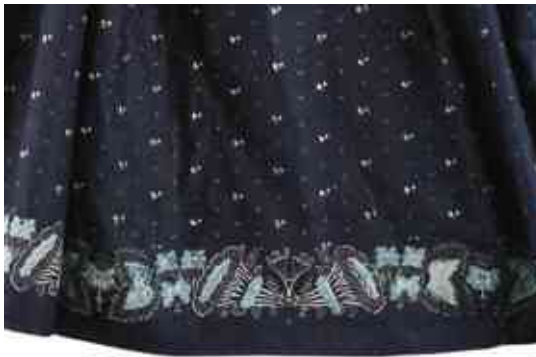
Fěrtoch z Černochovy barevny, VMP i.č. 967, detail

čtyři okolnice nad sebou v kombinaci barev světlomodré a bílé na modrofialové půdě. Modrotiskové výrobky prodávali rožnovští barvíři na jarmarcích ve Valašském Meziříčí, ve Frenštátě, ve Vsetíně, v Novém Hrozenkově, ve Velkých Karlovicích a v Horní Bečvě.